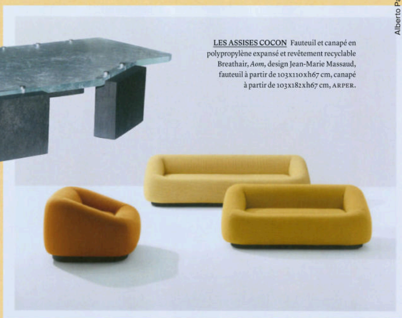
LES ASSISES COCON Fauteuil et canapé en polypropylène expansé et revêtement recyclable Breathair , Aom , design Jean-Marie Massaud, fauteuil à partir de 103x110xh67 cm, canapé à partir de 103x182xh67 cm, ARPER.

Alberto Parise: NM3