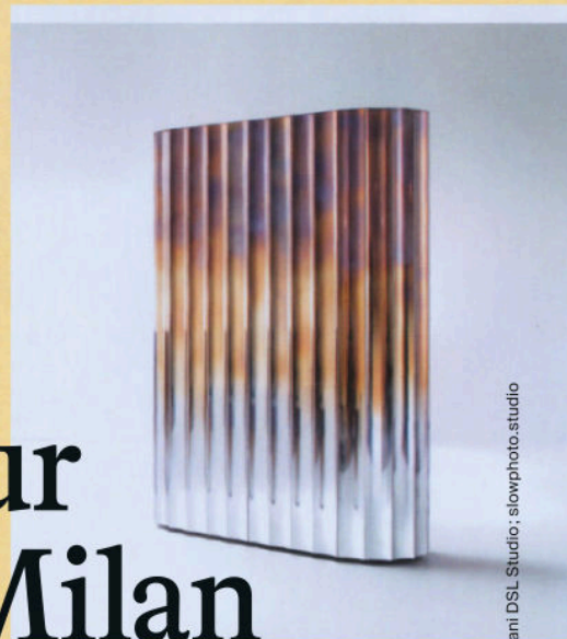
LE MODULE DORIQUE Buffet en acier inoxydable avec finition DeFauvé, collection Dorica , design Francesco Forcellini, à partir de 125x46x183 cm, DE CASTELLI.