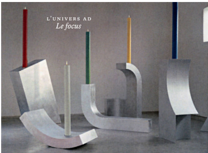
LES FLAMMES MÉTALLIQUES Chandeliers en aluminium avec bougie en cire, Silhouette , à partir de 60x50x160x280 cm, MULLER VAN SEVEREN.