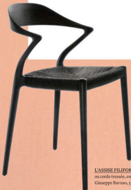
L'ASSISE FILIFORME Chaise en frêne massif ou corde tressée, en tissu ou cuir synthétique, Ori , design Giuseppe Bavuso, 55x50,5xh75,6 cm, RIMADESIO.