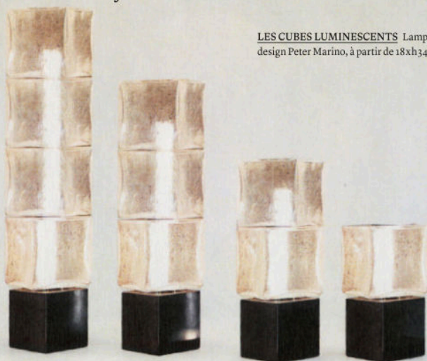
LES CUBES LUMINESCENTS Lampe en verre et marbre, On the Rocks , design Peter Marino, à partir de 18xh34 cm, VENINI.