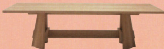
LE TRÉTEAU SYLVESTRE Table en orme, Ori , design Christophe Delcourt, 280x120xh74 cm, DELCOURT COLLECTION.