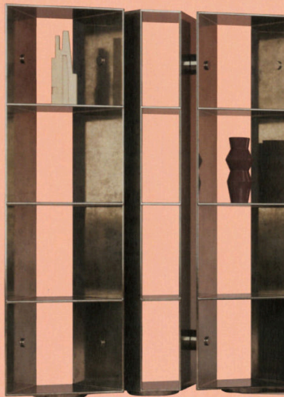
LA LIBRAIRIE INDUSTRIELLE Bibliothèque en acier, Y25_Bookcase , design Pietro Russo, à partir de 68x40xh180 cm, BAXTER.